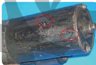
Nečitateľné číslo, chybajúci štítok