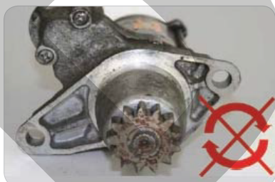
S hriadeľom sa nedá otáčať